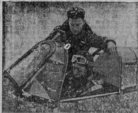
AN ENGLISH AIR MECHANIC bends over Soviet fighter pilot of a new 12-gun Hurricane fighter plane, one of hundreds of this type which have been shipped to Russia by Britain. Photo was taken during a snow storm, on a Russian airfield miles within the Arctic circle, where R.A.F. men shot down 13 German planes and escorted Russian bombers on raids against the enemy while teaching Soviet pilots how to fly and look after the Hurricanes which were turned over to them. When the R.A.F. men returned to Britain a few days ago, they said of their pupils: "You must certainly hand it to them for fast learning." Big convoys from British ports are taking more of the deadly craft to Russia every month.