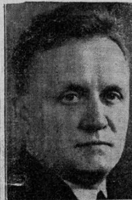
Dr. WALTER A. MAIER

Prácticamente desconocido fuera de su colegio superior hace siete años, el doctor Walter A. Maier es hoy una de las figuras máximas del aire. Su voz llega a millones de radioescuchas en todas partes del mundo; y el número de emisoras que transmiten sus mensajes ha crecido de dos a más de 170 estaciones norteamericanas. Además de transmitir por una cadena de estaciones que se extiende de costa a costa de los Estados Unidos, los programas del Dr. Maier se escuchan en cuatro continentes — en inglés, castellano, francés, portugués y holandés. Hace menos de un año su voz fue escuchada por primera vez en la América Latina y rápidamente se